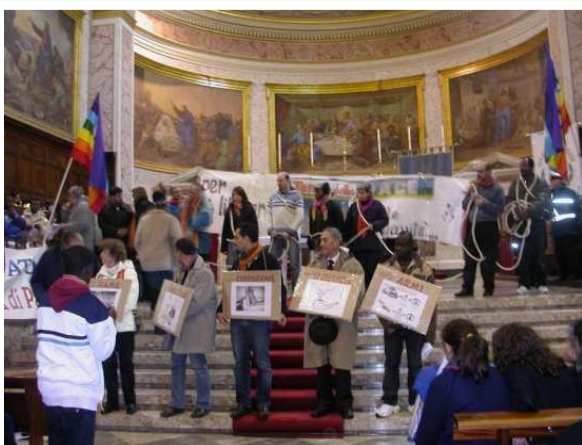
La presentazione del lavoro della Tenda della Pace