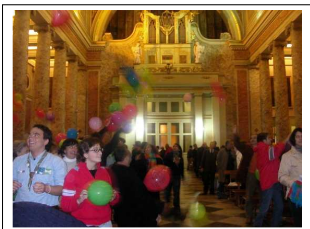
Momento di fraternità in cattedrale

19-20 novembre 2005 Giornate di sensibilizzazione sul tema dell'immigrazione.