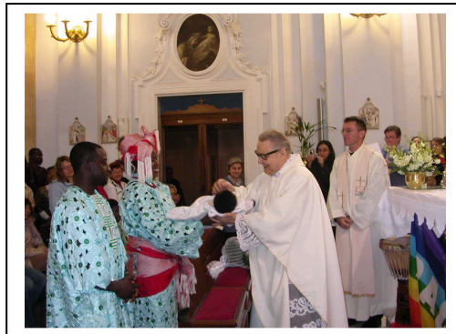
due giovani nigeriani sposati dal Vescovo Nogaro